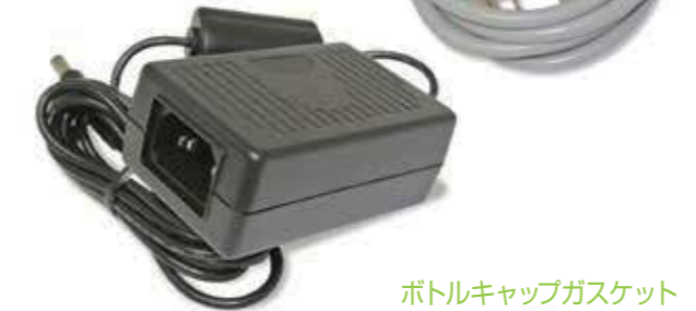
ボトルキャップガスケット