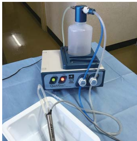
使用前の全体画像 （Yアタッチメント）