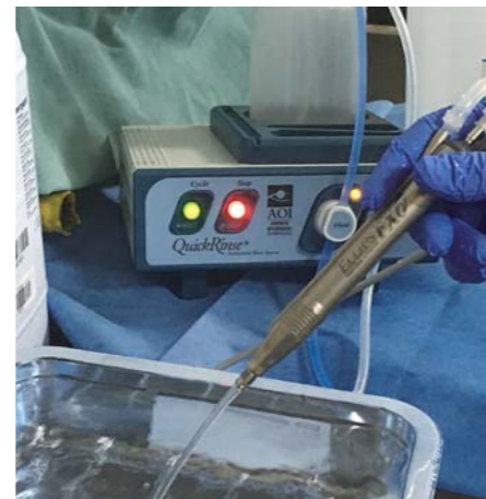
USハンドピース使用写真 （Yアタッチメント）