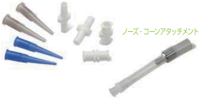
ノーズ・コーンアタッチメント