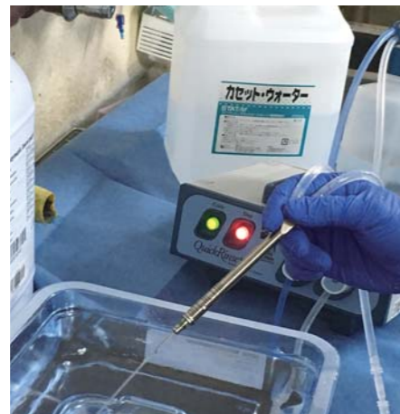
IAハンドピース使用写真 （Yアタッチメント）