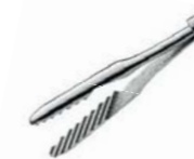
シャー氏 X-tra グリップ 鉗子 45°

先端のファインチップは45°セレイションのプラットフォーム形状になっています。ラウンド形状の先端は皮膜組織の断裂を減少させ、更に45°のセレイションは従来以上の強い把持力を可能にしています。先端サイズは、23G/25G/27Gから選択できます。