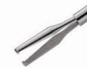
エックardt氏 ILM 鉗子 (エンドグリップ)

先端のチップ幅は全てのゲージで0.3mmとファインに製造されています。改良された先端プラットフォームは皮膜組織の断裂を減少されており、短い先端形状は、より強い把持力を可能にしています。先端サイズは23G/25G/27Gから選択できます。