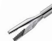
クーン氏 パワー 鉗子 45°

クーン氏パワー鉗子45°は、ILMやERMの皮膜を剥離するのに適しているだけでなく、増殖性の硝子体内の網膜上膜、水晶体被膜、虹彩、小さな眼内異物及び繊維膜等に対する処置へも大変適しています。先端サイズは、23G/25Gから選択できます。