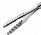
シャー氏 X-traグリップ鉗子 45°

先端のファインチップは45°セレイションのプラットフォーム形状になっています。ラウンド形状の先端は皮膜組織の断裂を減少させ、更に45°のセレイションは従来以上の強い把持力を可能にしています。先端サイズは、23G/25G/27Gから選択できます。