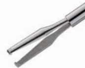
エッカード氏 ILM 鉗子 (エンドグリップ)

先端のチップ幅は全てのゲージで0.3mmとファインに製造されています。改良された先端プラットフォームは皮膜組織の断裂を減少されており、短い先端形状は、より強い把持力を可能にしています。先端サイズは23G/25G/27Gから選択できます。