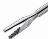
クーン氏 パワー鉗子 45°

クーン氏パワー鉗子45°は、ILMやERMの皮膜を剥離するのに適しているだけでなく、増殖性の硝子体内の網膜上膜、水晶体被膜、虹彩、小さな眼内異物及び繊維膜等に対する処置へも大変適しています。先端サイズは、23G/25Gから選択できます。